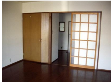
暖冷が逃げない為の玄関、台所との仕切りガラス戸。 9.8畳の洋間。